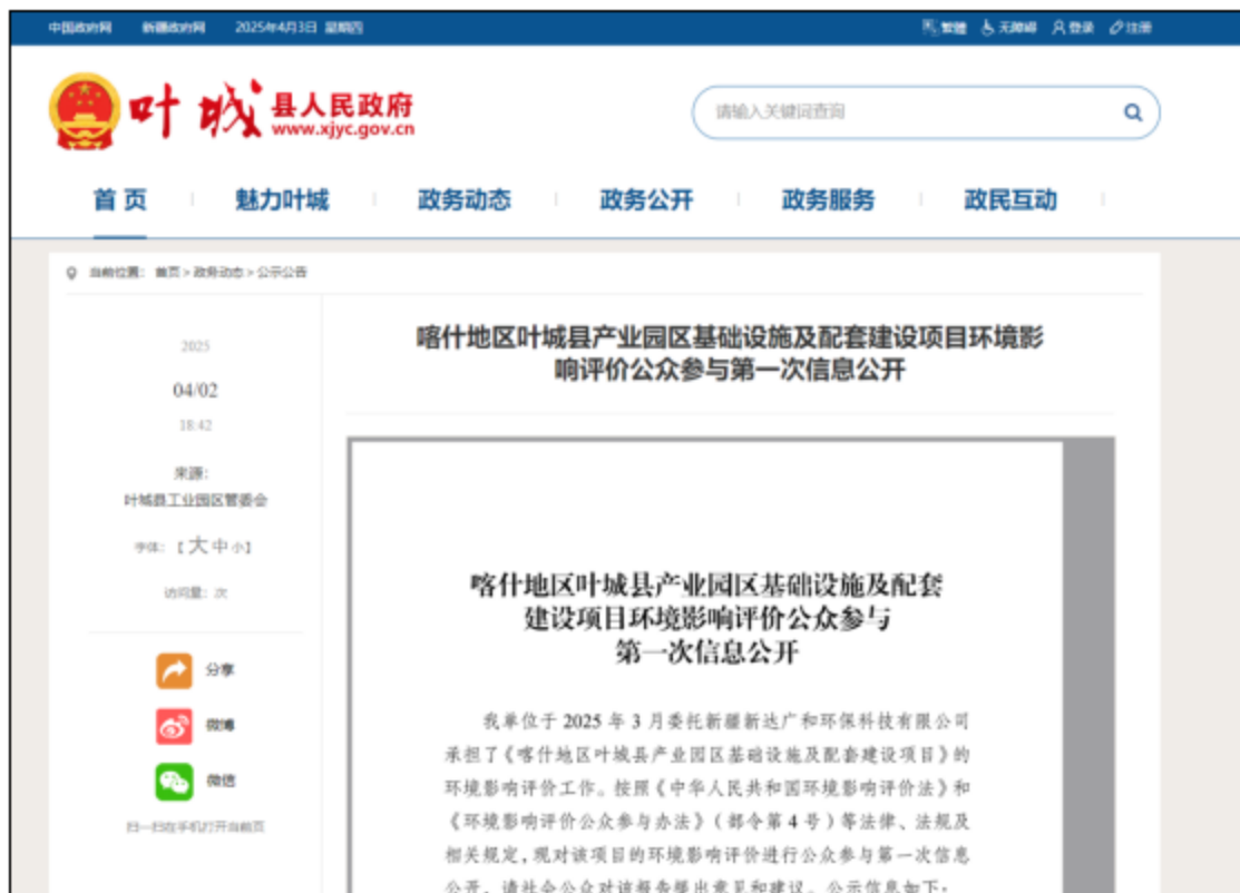
图 1 本项目第一次网上公示截图