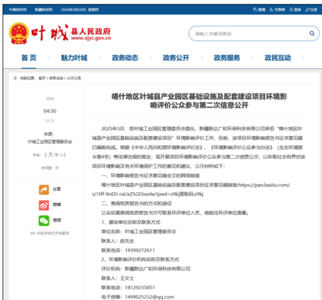
图2 本项目第二次网上公示截图