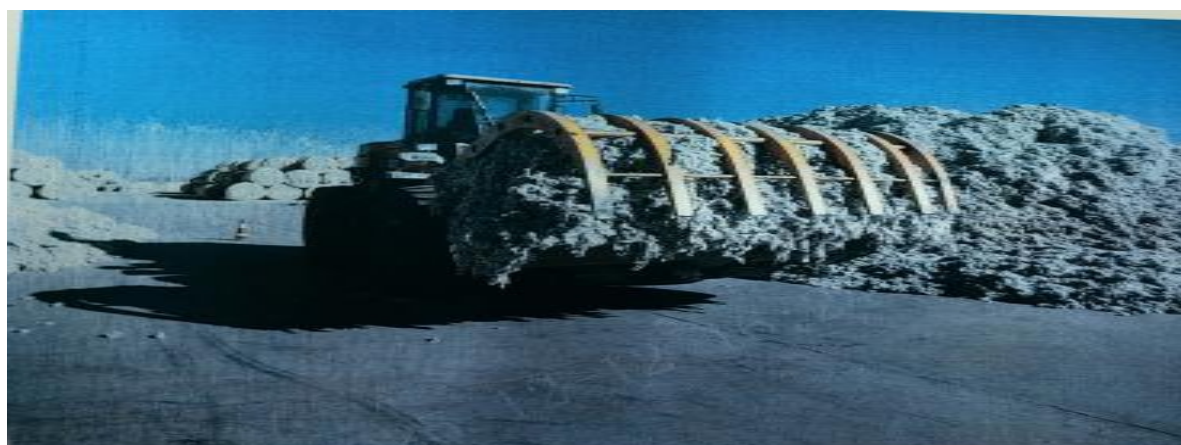
图 2.加装抓花爪子的装载机图片